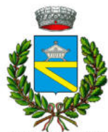
COMUNE DI CASCINA